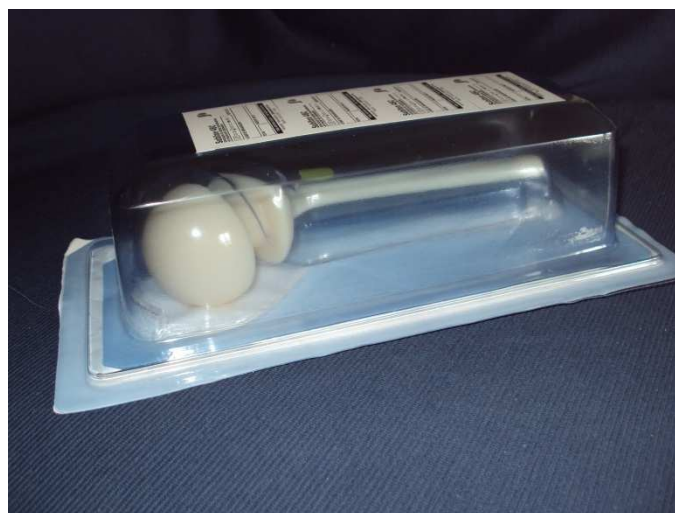
Lo spaziatore per anca nella confezione trasparente